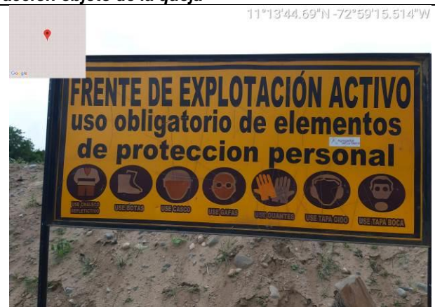
Foto 6. Valla informativa