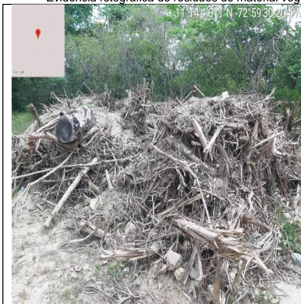
Foto 1. Residuo de material vegetal

Evidencia fotográfica de residuos de material vegetal acumulado en el área indicada anteriormente