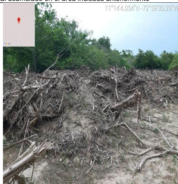
Foto 2. Residuo material vegetal