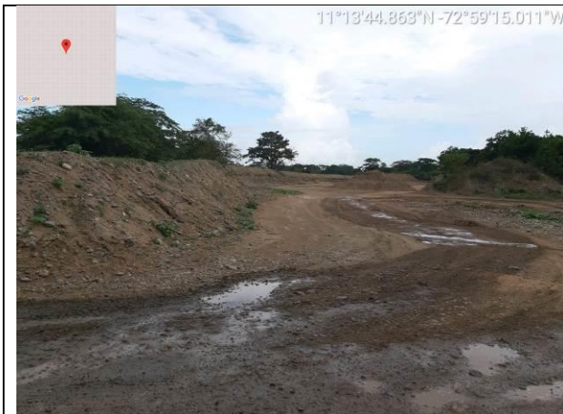
Foto 7. Área de extracción sitio de la queja