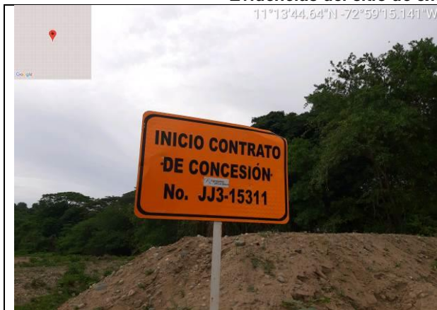
Foto 5. Valla en el área de extracción