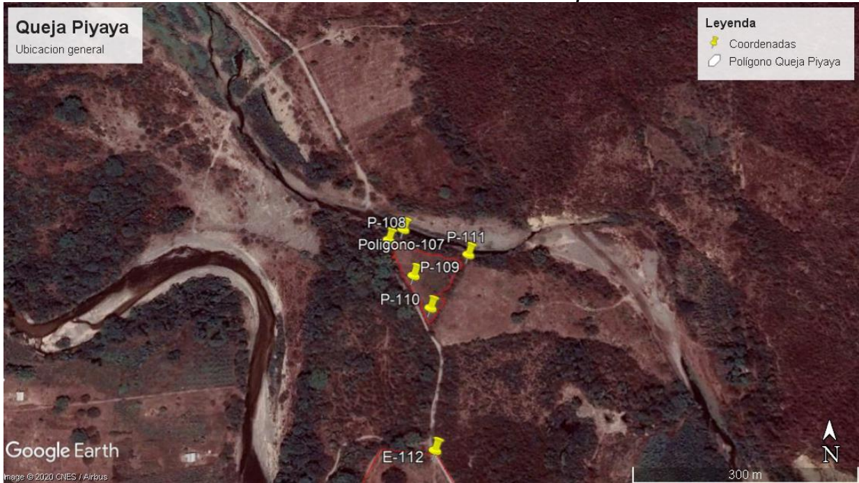
Imagen 1. Imagen tomada utilizando Google Earth – para ilustrar el sitio de acopio de residuo vegetal verificado en campo