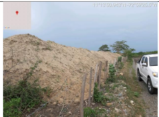
Foto 8. Material acumulado a orilla de la vía