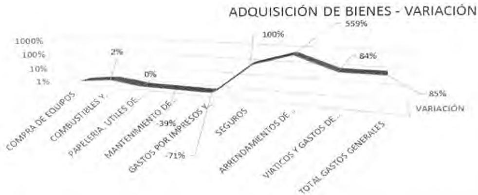
Gráfica No 5. La variación se presenta sobre el gasto presentado en el segundo trimestre de 2014, comparados sobre los registrados en el mismo periodo de la vigencia 2013.

Tal como lo muestra el Cuadro y Grafica No. 5, con relación a la variación en los Gastos Generales, podemos observar un aumento en los gastos de la cuenta Adquisición de Bienes, correspondiente al 85%, generado en la variación de pagos de $433,42 millones del año 2014 con respecto al año 2013; compuesto principalmente por el rubro de 'Viáticos y Gastos de Viajes' debido al desarrollo de programas, políticas y proyectos a cargo del Ministerio que ha permitido brindar apoyo en el territorio nacional; se presentó también disminución de gastos en los rubros como 'Compra de Equipos', este reducción se debe a que las compras de los mismos se programaron para meses posteriores de la vigencia 2014.