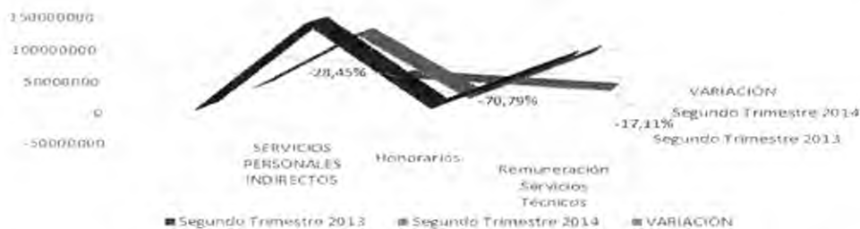
Gráfica No 3. La variación se presenta sobre el gasto presentado en el segundo trimestre de 2014, comparados sobre los registrados en el mismo periodo de la vigencia 2013.

En el cuadro y grafica No. 3, este rubro, de acuerdo a la información suministrada, revela una disminución en los pagos de gastos de 'Honorarios' (71%) y una disminución en el rubro de 'Remuneración de Servicios Técnicos' (17%), del segundo trimestre del año 2014, con relación al segundo trimestre de la vigencia 2013, reflejando una disminución total en los servicios personales indirectos correspondiente al -28.45% , esto obedece a la baja apropiación suministrada por el Ministerio de Hacienda en la vigencia 2014, para el rubro de "Servicios Personales Indirectos"; lo que solamente permitió efectuar contratación en las áreas de apoyo necesario, tales como Subdirección Administrativa y Financiera (Almacén y Correspondencia), Subdirección de Gestión Contractual y Oficina de Control Interno, lo que efectivamente disminuyó los pagos por contratación de servicios profesionales, ocasionando una disminución en el gasto en los servicios personales indirectos.