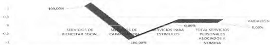
Gráfica No 2. La variación se presenta sobre el gasto presentado en el segundo trimestre de 2014, comparados sobre los registrados en el mismo período de la vigencia 2013.

En el cuadro y grafica No. 2, se observa una variación positiva (incremento) en los rubros de servicios de 'Bienestar Social', con un pago registrado equivalente al 7.83 millones en la vigencia 2014 con relación a la vigencia 2013, que obedecen a las actividades de "Teatro Itinerante" que se realizó el 27 de junio de 2014 y a la actividad Entrega de "Boletas de Cine", realizadas en el segundo trimestre de la vigencia actual, en el mismo período de la vigencia 2013, no se presentó gasto por concepto de actividades de Bienestar Social.