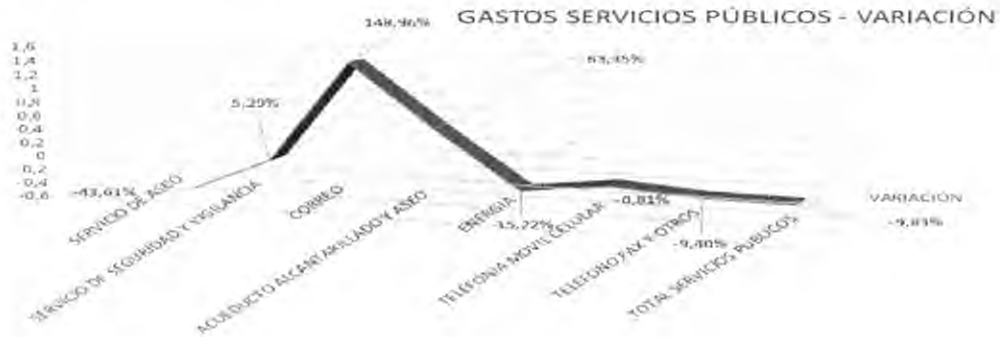
Grafica No 4. La variación se presenta sobre el gasto presentado en el segundo trimestre de 2014, comparados sobre los registrados en el mismo periodo de la vigencia 2013

Se observa, (Cuadro y Grafica No. 4), una disminución correspondiente al 9,83% del total de pagos en los rubros de 'Servicios Públicos', dentro del segundo trimestre de 2014 en comparación con el segundo trimestre de 2013, pasando de $1.026 millones en 2013 a $925,95 millones para el 2014 mostrando una disminución de $104.91 millones.